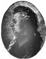
Mozart (Zie Radio-programma)